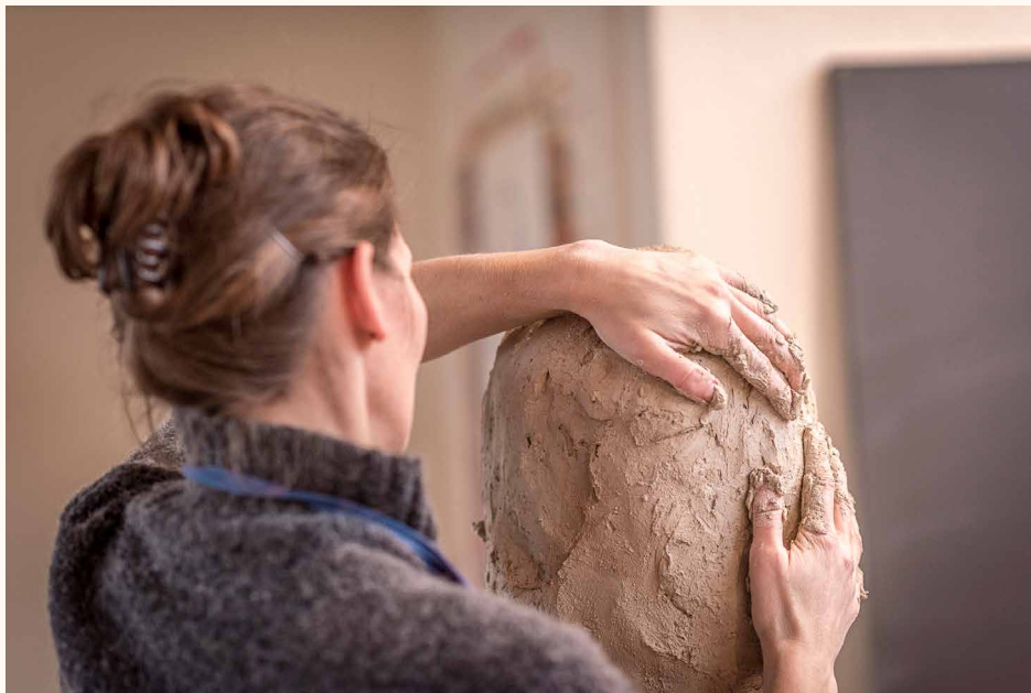
Unterstützen den Genesungsprozess: Komplementärtherapien wie die Kunsttherapie.

Schöb: Es braucht die Initiative des einzelnen Spitals, das sagt: «Wir wollen Integrative Medizin anbieten.» Das setzt Öffentlichkeitsarbeit voraus, um das Konzept bekannt zu machen, politisch braucht es stabile Rahmenbedingungen, und letztlich sind Lösungen für die Finanzierung