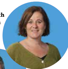
Franziska Roth Co-Präsidentin Dakomed, Ständerätin

Wir danken Ihnen herzlich für Ihre Unterstützung.